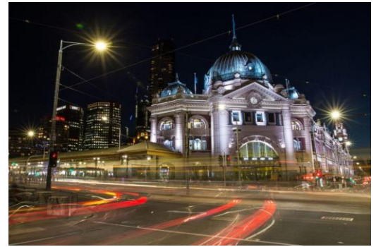
Campus PRIMUS, Melbourne

Nuestro Campus está localizado en las modernas premisas del centro de Melbourne con fácil acceso al transporte público, alojamiento y demás conveniencias necesarias. Ofrecemos ayuda después de clases, librería ¡y un montón de recursos!